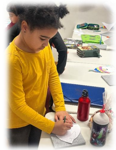
Das Gewicht der Schneeflocke