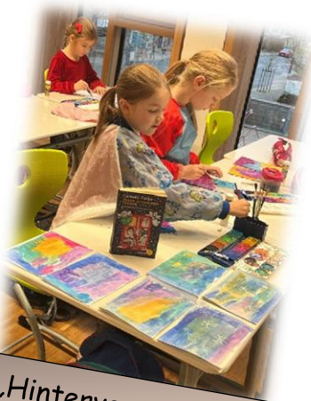
„Hinterverzauberten Fenstern“ von Cornelia Funke