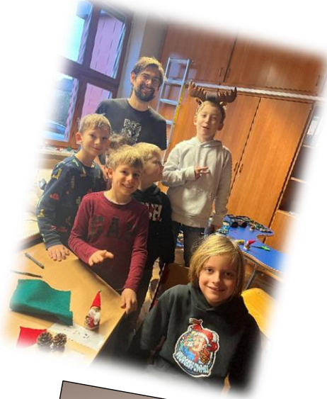
„Tomte Tummetott“ von Astrid Lindgren