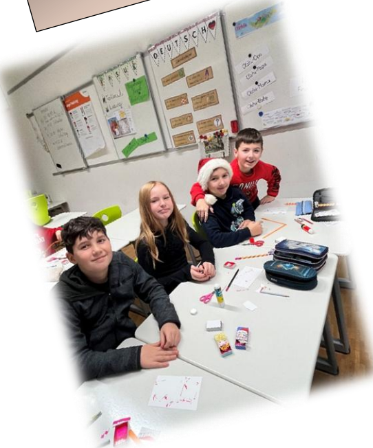
PopUp - Weihnachtsgrüße