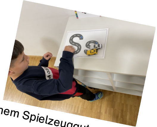
mit einem Spielzeugauto nachspuren