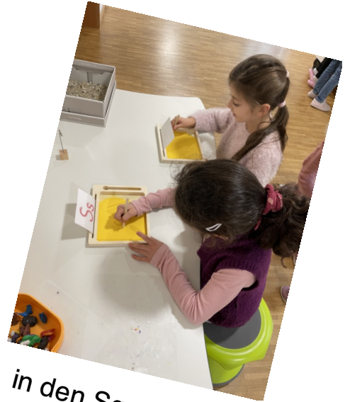
in den Sand schreiben