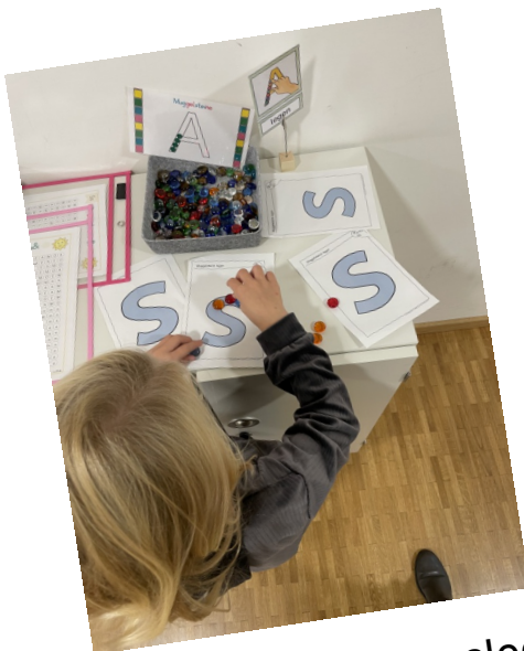
mit Glassteinen auslegen