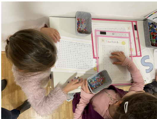
mit Perlen auslegen