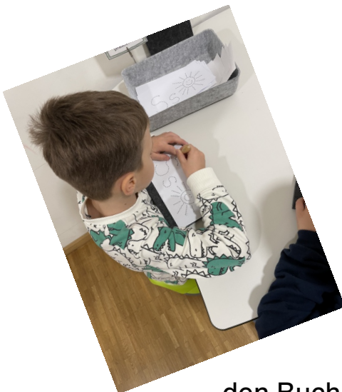
den Buchstaben prickeln