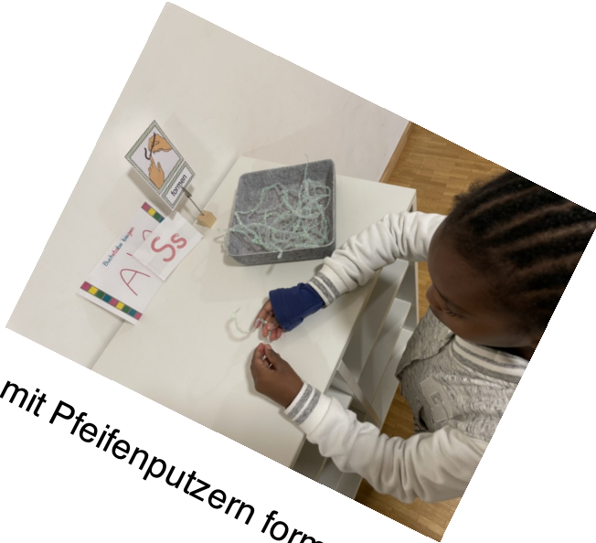
mit Pfeifenputzern formen

Die Erstklässler absolvieren dazu zu jedem Buchstaben verschiedene Stationen. Anbei ein paar Eindrücke der 1a: