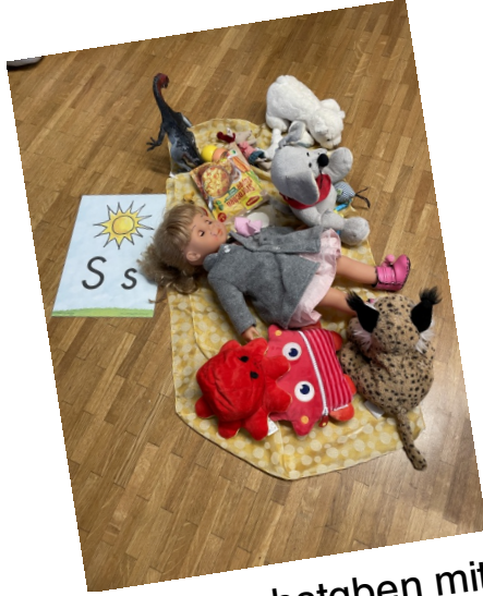
Gegenstände zum Buchstaben mitbringen