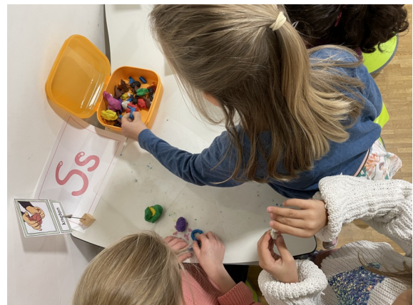
mit Knete formen